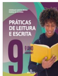
Cadernos 1 e 2