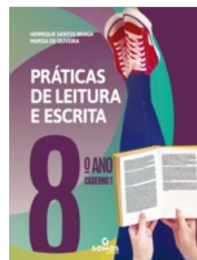
Cadernos 1 e 2