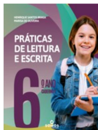
Cadernos 1 e 2