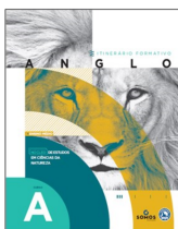
Núcleos de Estudos

⑤ Programa LíderemMim ® (vendidos na escola)